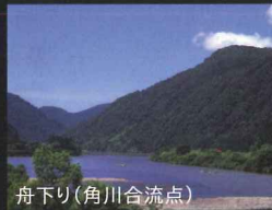
舟下り(角川合流点)